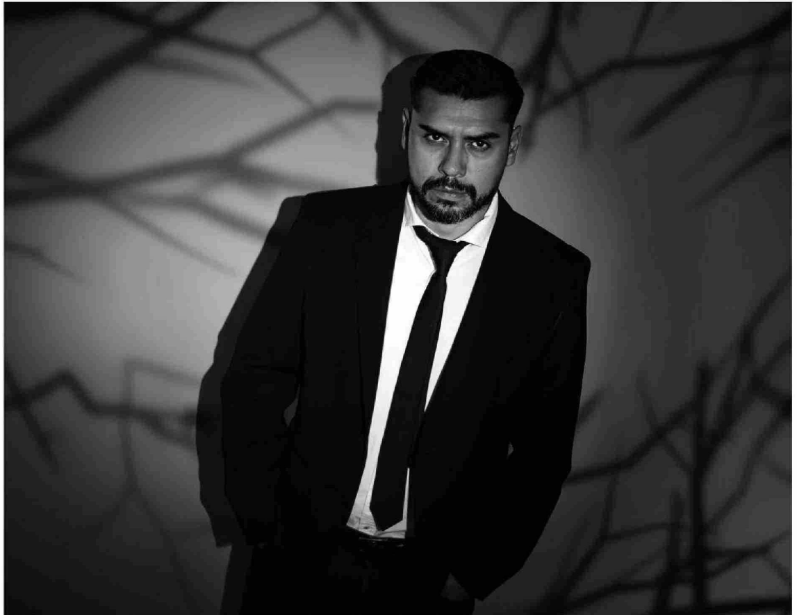
"Me demoro mucho en investigar, meses, incluso hasta un año estoy investigando para mis proyectos", dice el autor.

"Todos mis libros se basan en investigaciones. Yo no me demoro mucho en escribir, lo mío es la narrativa breve, me gusta como formato la nouvelle (narración entre el cuento y la novela), pero, si bien me demoro poco en escribir, me demoro mucho en investigar, meses, incluso hasta un año estoy investigando para mis proyectos", agrega el también autor de "Los que susurran bajo la tierra", cuya área "de investigación en la universidad es la estética del horror" y sus clases son de literatura creativa y oratoria. En estas últimas clases se mezclan estu-