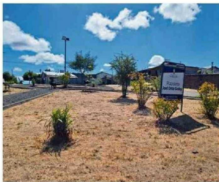
UNA VEZ ERRADICADOS, SE LE DA UN USO COMUNITARIO AL LUGAR.

la Dirección de Medio Ambiente de la Municipalidad de Chillán, explicó que "para lograr este objetivo, se realizan labores educativos con la comunidad a través de las juntas de vecinos, capacitando a vecinos puerta a puerta en la Ordenanza Municipal