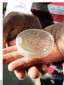
El trabajo con bacterias se ha realizado durante varios años.

una pista de que probablemente está muy adaptada al medio marino, porque el mar es ligeramente alcalino".