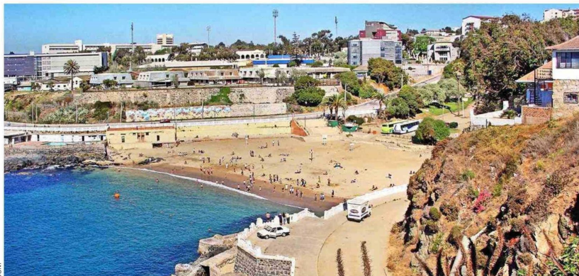
Playa Las Torpederas en Valparaíso, donde se realizó el descubrimiento.