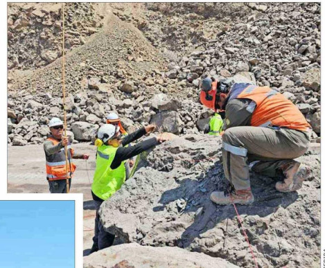
CARGAS EXPLOSIVAS. — Bajo medidas de seguridad, las tronaduras se realizaron cerca del mediodía y luego de ello la ruta fue despejada de escombros.

Trabajos en la única carretera que une a esa región con el resto del país se concentraron en detonaciones controladas de rocas. Casi en paralelo, las clases fueron suspendidas por precaución y autoridades llamaron a consumir agua envasada.