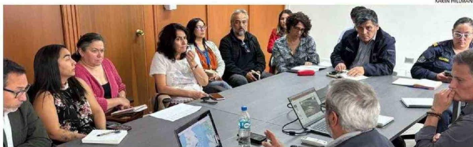
PRIMERA SESIÓN DEL AÑO DEL COMITÉ DE INTERINSTITUCIONAL DE CONTINGENCIAS AMBIENTALES (CIICA) DE LA REGIÓN DE LOS LAGOS, INSTANCIA SURGIDA PARA PREVER Y ANALIZAR EVENTOS AMBIENTALES.

Comité analizó datos sobre marea roja, descartando por ahora niveles tóxicos de la microalga Alexandrium catenella , aunque revelando inquietud por situación detectada en sector de la vecina Región de Aysén.