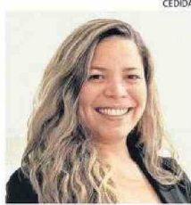
TARTAKOWSKY ES PSICÓLOGA.

El síndrome postvacacional es una realidad cada vez más común entre los laborantes, lo que trae consecuencias tanto personales como para las empresas u organizaciones por el nivel bajo de productividad.