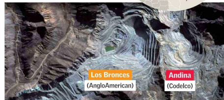
Producción de Andina y Los Bronces En miles de toneladas de cobre fino.