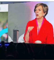
Evelyn Matthei en el panel por el crecimiento, donde destacó el caso argentino como un modelo imitable. “El gasto fiscal hay que reducirlo, como lo está haciendo en este momento Argentina, que por primera vez ha tenido un superávit fiscal”.