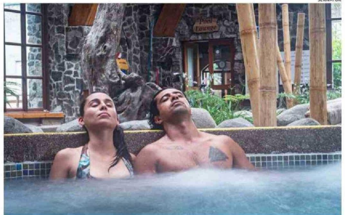
LAS TERMAS DE PUYEHUE, EN LA PROVINCIA DE OSORNO, OFRECEN RELAJO Y CONTACTO CON LA NATURALEZA PRÍSTINA DEL PARQUE NACIONAL PUYEHUE.

La también directora de la cámara regional añadió que “los hoteles, los emprendedores están instalados todo el año, tienen capacidad para eso, tienen gente