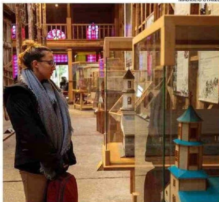
EL MUSEO DE LAS IGLESIAS DE CHILOÉ, EN ANCLUD, ES DE GRAN INTERÉS PARA QUIENES DESEAN CONOCER MÁS SOBRE LA ARQUITECTURA CHILOTA.

cremento inédito en el número de visitantes desde Argentina, lo que sin duda representa una gran oportunidad para nuestro comercio y servicios locales. Sin embargo, para recibir a estos turistas y a quienes también llegarán desde otras partes de Chile y el extranjero, debemos estar preparados y superar algunas brechas que aún persisten en infraestructura”, afirmó el dirigente.