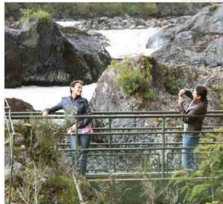
LOS SALTOS DEL PETROHUÉ, EN LA PROVINCIA LLANQUIHUE (ARRIBA), Y LA INCONFUNDIBLE IGLESIA SAN FRANCISCO DE CASTRO (DER.).