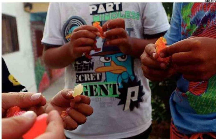
EN ANTOFAGASTA UN 20,7% DE LOS ALUMNOS EVALUADOS PRESENTAN CUADROS DE OBESIDAD SEVERA.

46% de alumnos evaluados presentan un peso normal, lo que se acerca al período de prepandemia.