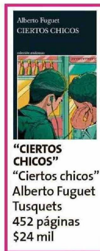
"CIERTOS CHICOS" "Ciertos chicos" Alberto Fuguet Tusquets 452 páginas $24 mil

quizás tiene otro tipo de poder. -Ahora esta novela pasa durante el régimen, época en que igual había fiestas, la gente se seguía enamorando. -Sí, pero yo lo veo de otra manera: obviamente que también había fiestas, y ahora, en Ucrania, igual, pero la cultura que celebran en este libro también es un acto de oposición, la vida contra la muerte, la cultura (de) el apagón se combate con luz. -No hay Eros sin Tánatos. -Exacto, va por ahí: en un mundo de Tánatos tienes que apostar por el Eros. Estos chicos no podían esperar a que llegara la democracia o tiempos mejores para vivir sus vidas. "ME DABA MIEDO" -¿Por qué escribir sobre la universidad después de tantos años de tu egreso? -Porque me daba miedo. -¿Porque te iban a molestar como a Clemente? -Sí, y porque lo mío fue una etapa muy traumática. -Porque te molestaban. -No sólo porque me molestaban, porque me parecía que era el infierno. O sea, el bullying es súper mo-