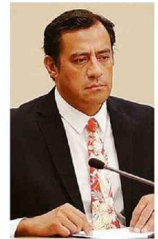
LOS DIPUTADOS CELIS Y TEAO MANIFESTARON PREOCUPACIÓN.