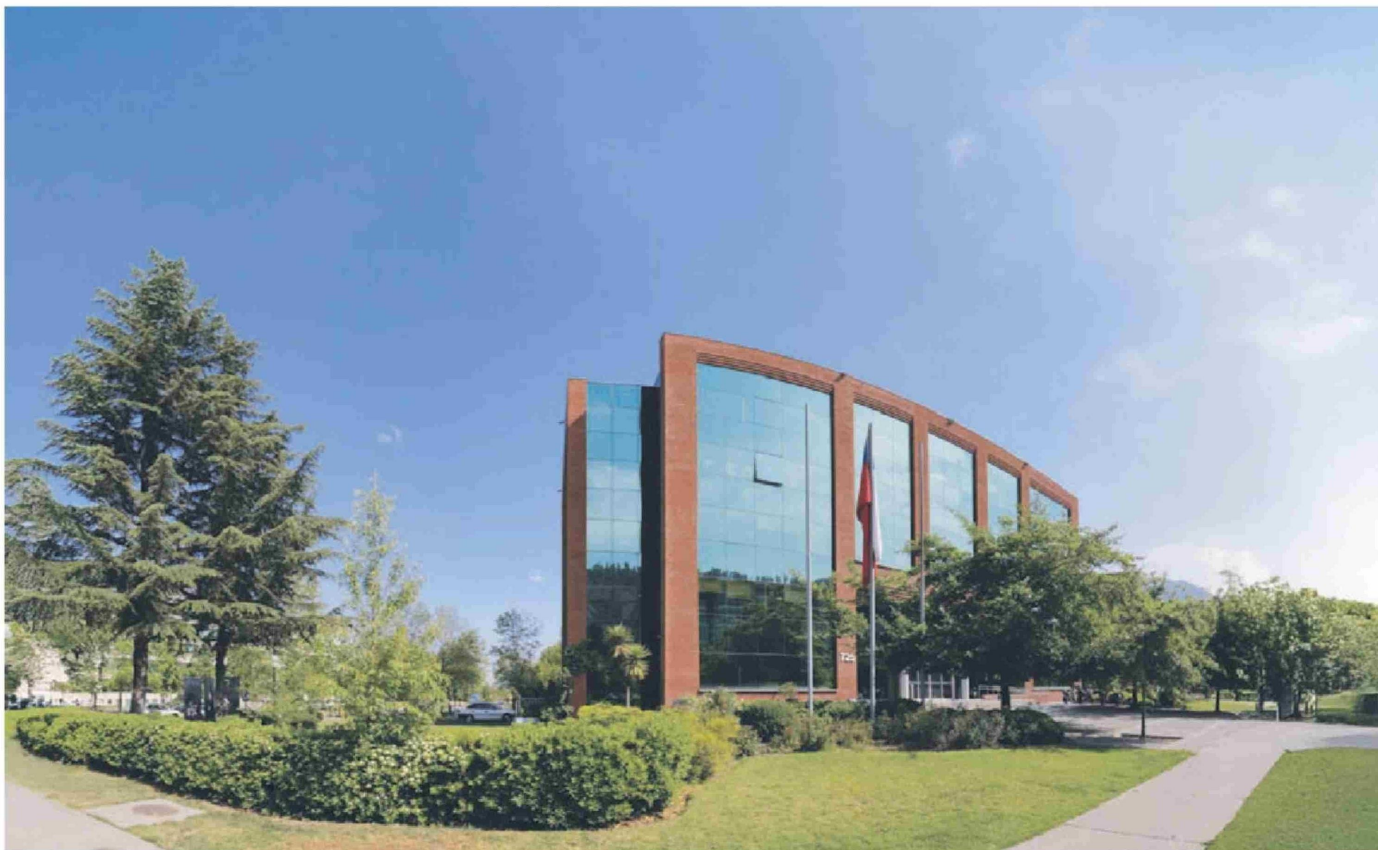
El nuevo Parque de Ciencia, Innovación y Emprendimiento de la Universidad San Sebastián en Huechuraba.

Título: U. San Sebastián invierte US$ 65 millones en infraestructura Concepción y Valdivia en Santiago,