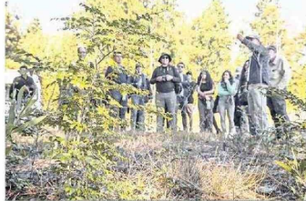
En el marco del compromiso institucional con la sustentabilidad el proyecto Campus Naturaleza, se convierte en un legado bio cultural de la UdeC para las próximas generaciones.