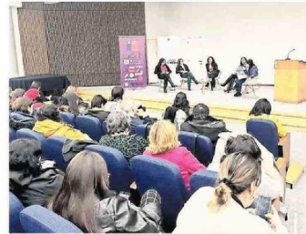
Los vínculos con el sector público se ven reflejados en acciones como el ciclo de conversatorios Vinculación y territorios: contribuciones desde la academia, que en su primer encuentro se realizó junto a la Sernameg,

tido social, son algunos de estos ejemplos de trabajo interno en el área de la formación.