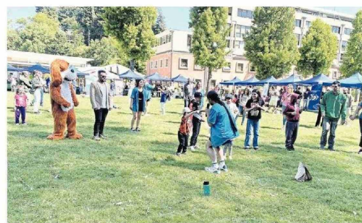
Cada noviembre se realiza la Semana de las Infancias, actividad que tiene como objetivo fomentar el compromiso UdeC con estos temas y colaborar con la comunidad en la promoción de los derechos de los niños y niñas.