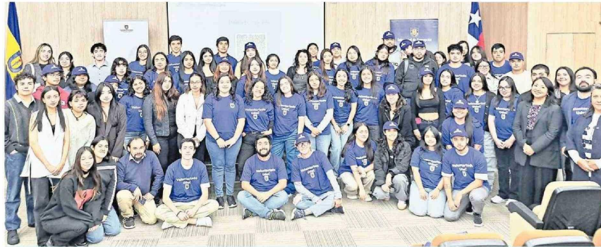
Voluntariado UdeC es una iniciativa que se articula a través de dos asignaturas complementarias que buscan potenciar las diversas habilidades y capacidades de la comunidad estudiantil de los tres campus.

A nivel interno, diversas son las iniciativas que se impulsan desde la VRIM, las que dan cuenta de la transversalidad del trabajo de VCM y su activa vinculación con el medio cultural, social-comunitario, público-político y productivo. El programa Prácticas con Impacto a través del cual se invita a estudiantes de diversas facultades y carreras a realizar su práctica profesional y contribuir al desarrollo de las comunidades en el BíoBío, Nuble y Araucanía, mediante asesorías de intervención comunitaria integral, así como el Voluntariado UdeC, iniciativa que, desde la VRIM, se articula a través de dos asignaturas complementarias que buscan potenciar las diversas habilidades y capacidades de la comunidad estudiantil de los tres campus, para proporcionar una formación integral y consen-