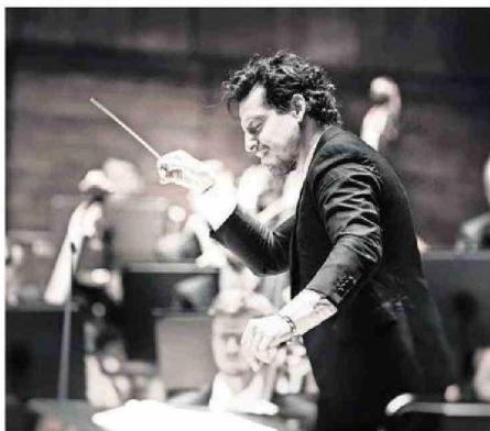
El director ha sabido traducir los estados expresivos de Mahler.

de mi carrera, porque esos primeros años -2014 a 2017- lo que estaba haciendo era aprender profesionalmente, pero haciéndome de repertorio nuevo, aprender a ponerme frente a una orquesta, también aprender a escuchar, ensayar. De verdad, en lo personal, le tengo un cariño enorme a la Orquesta de la UdeC, porque fueron años súper valiosos para mi formación profesional. Vuelvo ahora, que han pasado seis años de crecimiento, pero es emocionante reencontrarse con amigos, caras conocidas y es súper gratificante que te den una bienvenida tan del corazón (...) Es como estar en casa nuevamente.