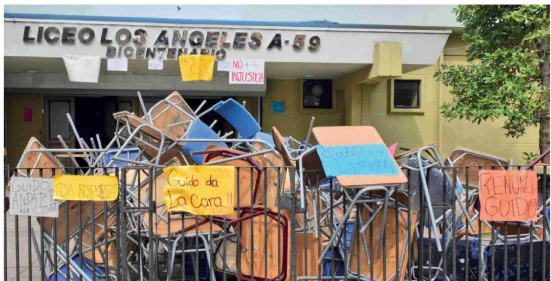
CON EL MOBILIARIO del propio establecimiento, los alumnos del Liceo Bicentenario de Los Ángeles se tomaron el recinto educativo.

Jefe del DAEM expresó su voluntad de "clarificar situaciones y llegar a acuerdos de mejora y de trabajos que están en proceso de licitación. También con el área de convivencia escolar para dar respuesta a sus demandas".