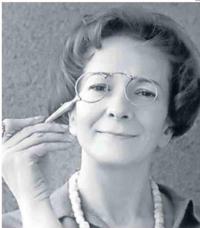
LA AUTORA RECIBIÓ EL PREMIO NOBEL DE LITERATURA EN 1996.

Porque los felinos de Szymborska se quejan de la partida de su dueño: "Morir, eso no se le hace a un gato. /Porque qué puede hacer un gato/en un piso vacío. /Tregar por las paredes. /Restregarse entre los muebles. /Parece que nada ha cambiado /y, sin embargo, ha cambiado", señala la autora encarna-