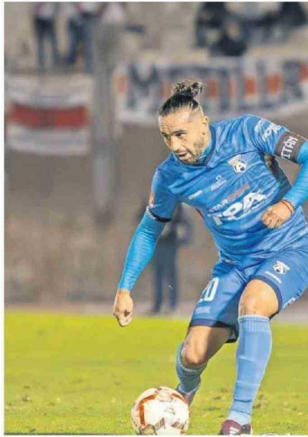
ENTRE SUS GOLAZOS, ESTÁ EL ANOTADO A LOS 70' ANTE WANDERERS.

Con respecto a la irregular segunda rueda protagonizada por el elenco Sanmarquino, el "20" sin pelos en la lengua le pidió disculpas a los fieles seguidores de Los Bravos. "Por la campaña tan baja que hicimos este año sobre todo de local. En los últimos años nos habíamos caracterizado por hacernos