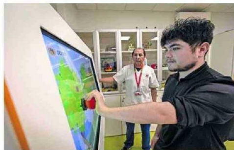
EL CENTRO CUENTA HOY CON MODERNAS TECNOLOGÍAS.

Junto con mejorar las áreas de atención terapéutica e incorporar medidas de eficiencia energética el centro sumó modernos dispositivos de rehabilitación robótica, que permiten potenciar los avances de los usuarios del centro.