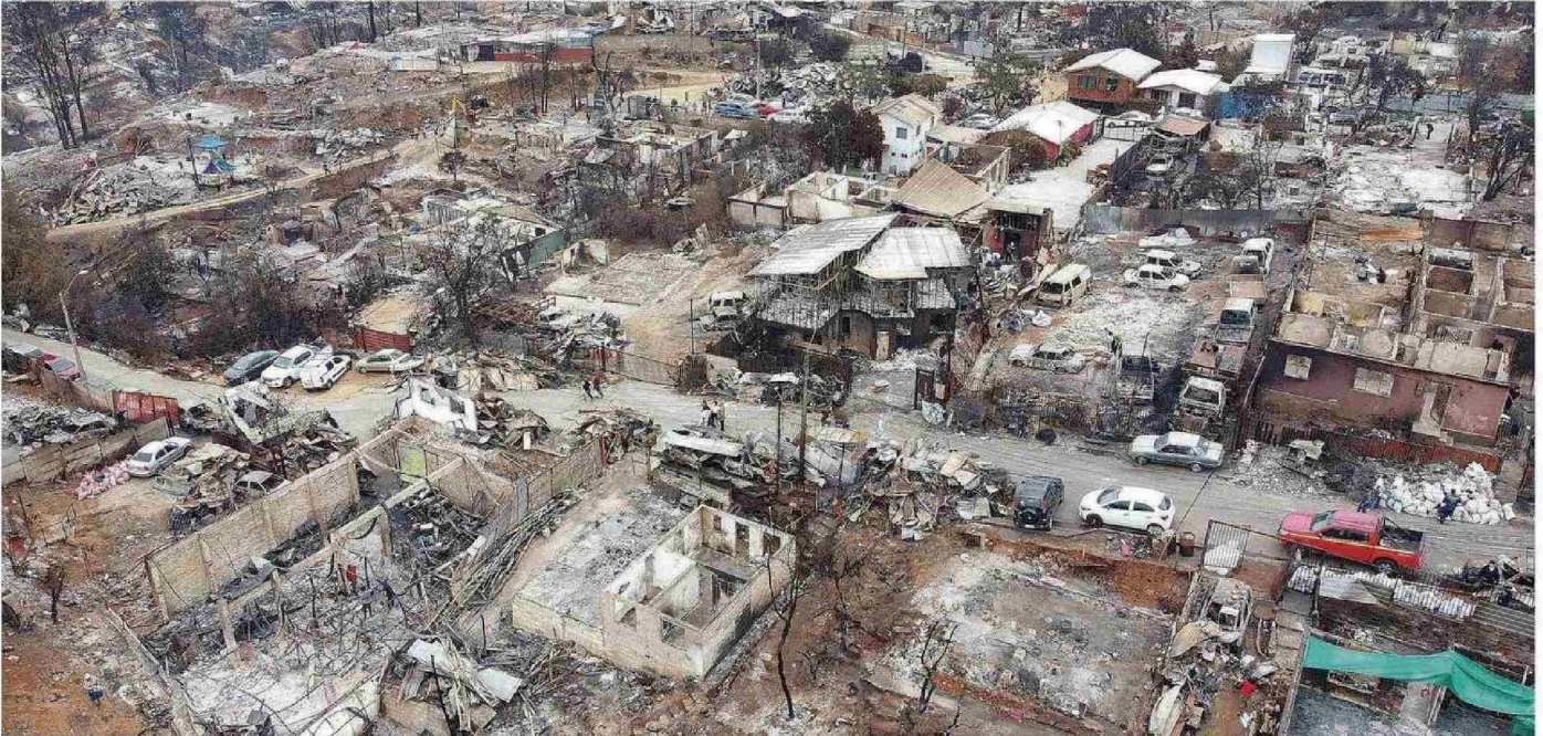
MUERTE, DESTRUCCIÓN Y DOLOR DEJÓ EL CATASTRÓFICO INCENDIO QUE ARRASÓ CON CUADRAS COMPLETAS DE VIVIENDAS EN EL SECTOR DE ACHUPALLAS, CUYOS HABITANTES LUCHAN POR RECUPERAR SU VIDA ANTERIOR.