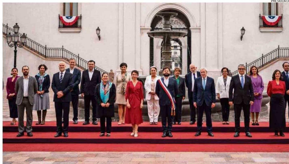
PRESIDENTE EN LA FOTO OFICIAL POR EL "18", CON 22 DE 24 MINISTROS. DE LA MUJER Y ENERGÍA SE AUSENTARON.

EDUCACIÓN SUPERIOR. Proyecto se presentaría el domingo, pero Boric viajaría a la asamblea de la ONU. La Parada Militar también se redujo: es hoy a las 11:00 horas.