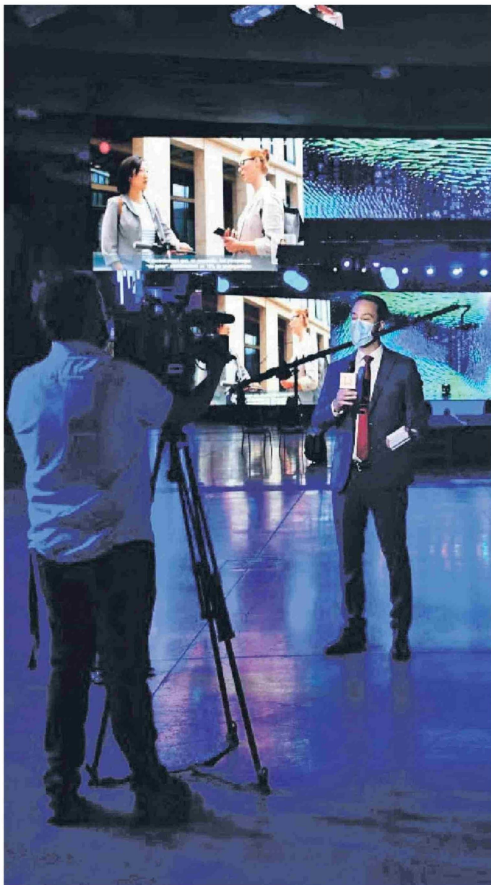
► En 2021, debido a la pandemia, el evento se realizó completamente online.