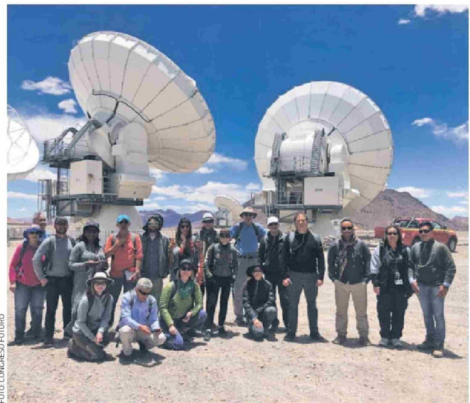
► Expositores del Congreso Futuro en el radiotelescopio ALMA.