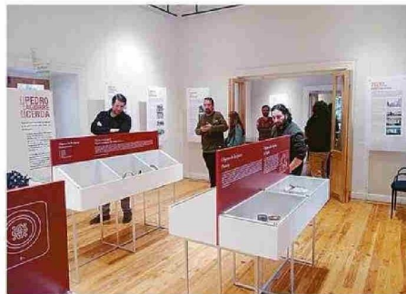
EXPOSICIÓN DE PERTENENCIAS DE PEDRO AGUIRRE CERDA.