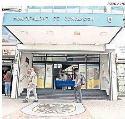
CONCEPCIÓN CAMBIARÁ DE ALCALDE TRAS LA PRÓXIMA ELECCIÓN.