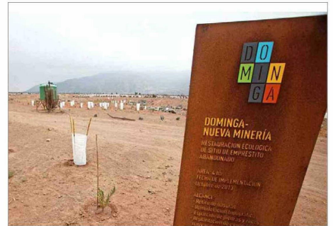
Es tercera vez que un Comité de Ministros se pronunciará sobre el proyecto minero-portuario Dominga.

En este sentido, quien debiese asistir a la reunión por parte de la cartera de Salud es la subsecretaria de Salud Pública, An-