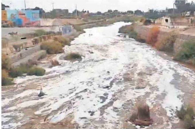
ESTE AÑO LAS LLUVIAS PROVOCARON EL AUMENTO DE LOS CAUDALES DE LOS RÍOS COMO EL RÍO LOA.

En este sentido, Cortés recomendó la instalación de techumbres provisionales para la protección de corrales y la conservación de los fardos de alfalfa en lugares secos y seguros, con el fin de evitar pérdidas en la actividad ganadera. “Poder mantener techumbres provisionales hasta que pueda