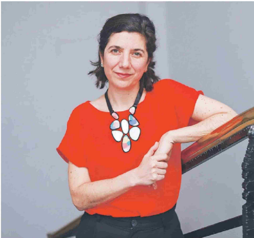
► Ministra de Ciencia, Tecnología, Conocimiento e Innovación, Aisén Etcheverry.