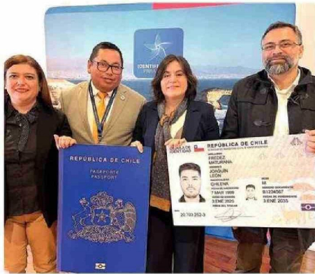
AUTORIDADES HICIERON LA PRESENTACIÓN DEL SISTEMA.

Además, indicó que estas renovación incluye un data center, nuevos mobiliarios e instrumentos tecnológicos, mejoramiento de conexiones de redes eléctricas y de comunicaciones en oficinas.