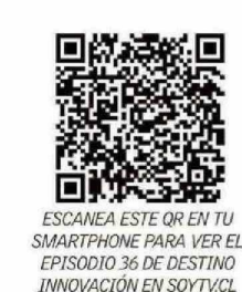
ESCANEA ESTE QR EN TU SMARTPHONE PARA VER EL EPISODIO 36 DE DESTINO INNOVACIÓN EN SOYTV.CL

Asimismo, resalta que la innovación está presente en todos nosotros y no es exclusiva de los tiempos modernos. Cita como ejemplo una obra que vio en los temporales teatrales de Puerto Montt, donde un hombre del siglo XVI se consideraba a sí mismo como moderno. "Esto demuestra que, en cada época, las