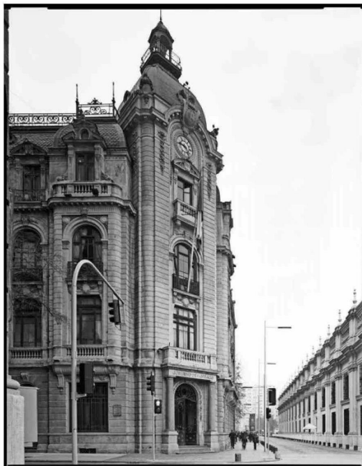
El primer arquitecto titulado de la UC, Manuel Cifuentes Gómez, proyectó el edificio que hoy ocupa la Intendencia de Santiago.

—Si uno mira en términos de impacto público, hay una cantidad importante concentrada en un período determinado en el que hubo gran producción arquitectónica vinculada a la ciudad, entre 1950 y 1970. No elegimos muchas casas, sino más bien construcciones que están en la calle, no todas demasiado emblemáticas, pero que han envejecido