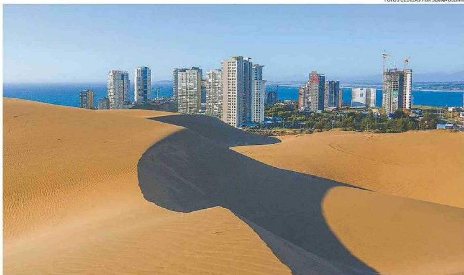
DUNAS DE CONCÓN: AL SER UN CAMPO DE DUNAS FÓSILES SON UNA GEOFORMA NATURAL EXTREMADAMENTE FRÁGIL