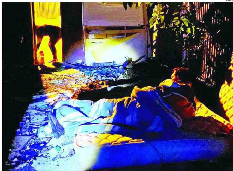
LOS RUCOS IMPROVISADOS EN CUALQUIER RINCÓN DE LAS CALLES SON EL HOGAR DE MUCHAS PERSONAS EN LA REGIÓN.

En Ancud, en la provincia de Chiloé, está el Albergue Público con 20 cupos por 150 días, ejecutado por