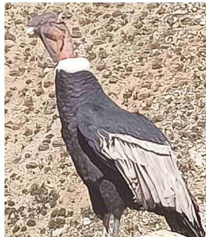
El cóndor es el ave nacional de Chile y vuela planeando corrientes de aire, pudiendo llegar a los 8 mil metros de altura y alcanzar velocidades de hasta 50 kilómetros por hora.

El cóndor es un ave de carroña que vive en las zonas cordilleranas de todo el país. Se caracteriza por su gran tamaño, ya que puede medir hasta 1 metro 30 centímetros de altura y puede llegar hasta los 3 metros con sus alas extendidas. Pesa alrededor de 12 kilos y tiene un anillo de plumas blancas en su cuello y punta de sus alas. Es el ave nacional de Chile y vuela planeando corrientes de aire, pudiendo llegar a los 8 mil metros de altura y alcanzando velocidades de hasta 50 kilómetros por hora.