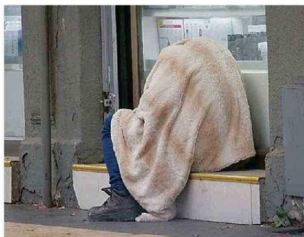
PARA IR EN SU AYUDA, SE PUEDE UTILIZAR EL FONDO CALLE.

"El Estado tiene una deuda histórica sobre cómo abordar el tema de la salud mental, consumo de drogas y alcohol de estas personas que hoy día no permite su reinserción. Por esta razón,