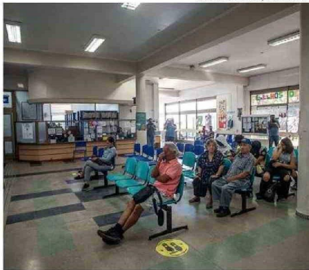
ÁNCERES QUE A MENUDO NO PRESENTAN SÍNTOMAS EN SUS PRIMERAS ETAPAS.

“Me salvó la vida ir al control con el urólogo a los 40 años”, afirma Vergara en conversación con prensa UDALBA. “Se ha hecho una demonización por el tema de la próstata, una parodia, una idea de echarlo a la talla. Por eso no estamos yendo al urólogo a los 40 años, pero hacer eso me salvó”. A raíz de su experiencia, el subsecretario hace un llama-