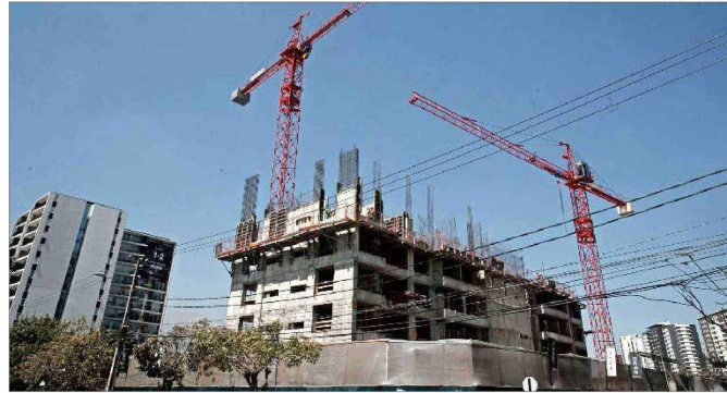
Entre enero y marzo de 2024, según cifras de CChC, las ventas de viviendas nuevas a nivel nacional cayeron casi 13% anual, totalizando solo 8.580 unidades, la cifra trimestral más baja en casi cuatro años.

El gerente de Estudios y Políticas Públicas de la CChC, Nicolás León, analizó el efecto de las acciones del Ejecutivo en materia de infraestructura y vivienda. Indicó que “aunque se observa un ritmo adecuado de