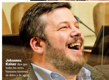
Johannes Kaiser dice que todos los seres humanos tenemos de dulce y de agrio.