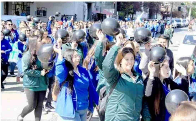
Con globos negros se manifestaron con molestia por la falta de materiales y mejoramiento en los recintos.