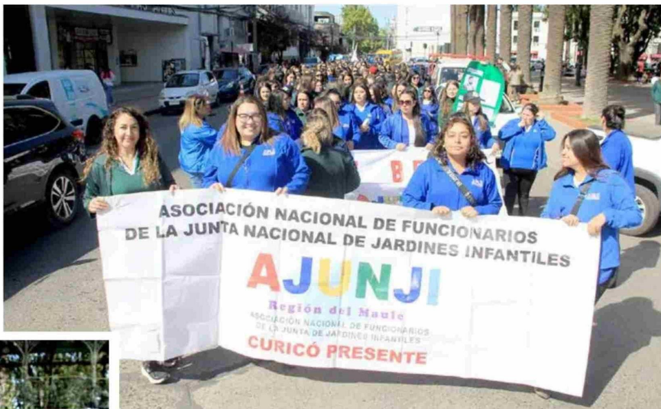
Alrededor de 300 trabajadoras de la Junji se plegaron a a la marcha convocada por este organismo.

POR CYNTHIA LEMUS SOTO