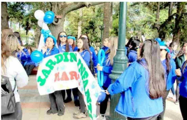
El punto de encuentro fue la Plaza de Armas de Curicó.