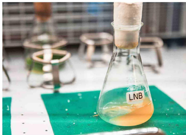
Recipiente de laboratorio con agua residual y E. coli.