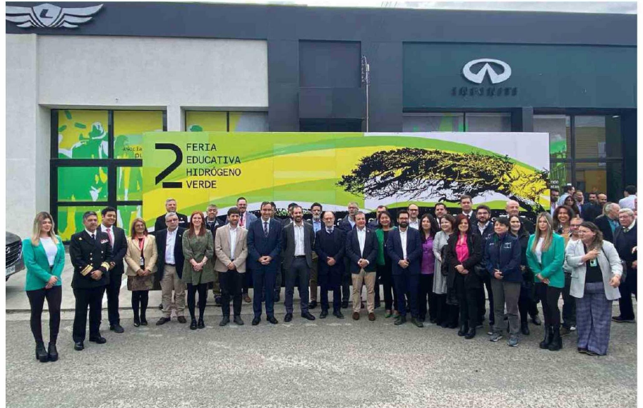
OTRO HITO IMPORTANTE EL AÑO PASADO, A RAÍZ DEL CRECIENTE INTERÉS DE LA INDUSTRIA DEL HIDRÓGENO EN MAGALLANES, FUE LA REALIZACIÓN DE LA FERIA DEL HIDRÓGENO EN PUNTA ARENAS.