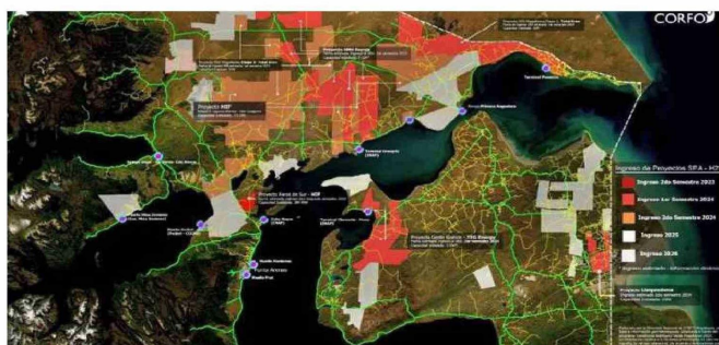
EL MAPA MUESTRA LA MAGNITUD QUE HAN ALCANZADO LOS PROYECTOS DE HIDRÓGENO VERDE EN ESTUDIO O CALIFICACIÓN AMBIENTAL EN LA REGIÓN.

La empresa solicitó que el plazo para responder a todas estas observaciones se extienda hasta el 29 de agosto, lo que fue acogido por el Servicio