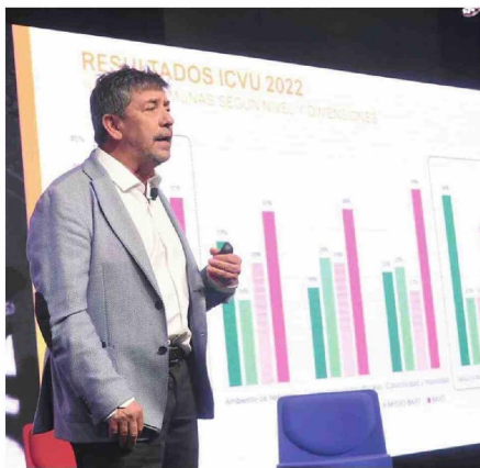
DURANTE LA ENTREGA DE LOS RESULTADOS DE LA CCHC.

Estudio de la Cámara Chile de la Construcción comparó los resultados de 2021 y 2022, incorporando el impacto de la pandemia en los habitantes de la capital regional.