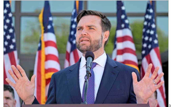
El senador JD Vance.