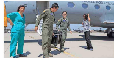
En Chile, todos los mayores de 18 años son donantes, salvo que la persona exprese su deseo de no serlo con una declaración jurada ante notario. Pero, al final, la opinión de la familia es decisiva.

Mejorar la comunicación e información es clave, además, para revertir porcentajes preocupantes, según Buckel, como que casi un tercio (29%) dice que no donaría por desconfianza hacia el sistema de listas de espera y el 19% por temor a que lo dejen morir para usar sus órganos. “Todos los profesionales que participamos del proceso damos fe de que las listas de espera son transparentes y que se manejan según criterios internacionalmente aceptados”.