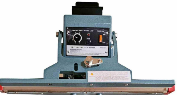
Selladora de pedestal.

En el corazón del negocio están también las máquinas selladoras, con una amplia variedad de modelos para distintas necesidades. Desde equipos portátiles y de sobremesa, como las selladoras