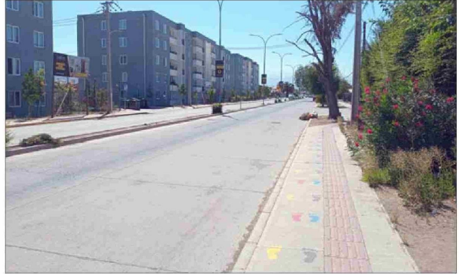
Se supone que iban a gestionar lomos de toro en la avenida.

Espera que con esta publicación puedan hacer algo, «ya que hay muchos