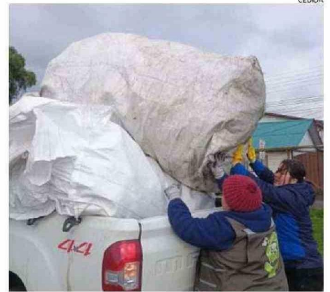
PLÁSTICO, VIDRIO, ACEITE Y LATAS SE OBTUVO PARA PODER RECICLAR.