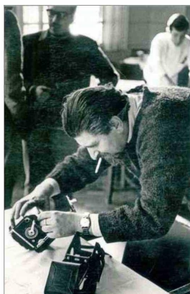
Ehrmann durante el Festival de Cine de Viña del Mar (1968).

La iniciativa de pesquisa continuará con la composición de un acervo digital, al que se accederá desde el centro de documentación universitario, y la posterior publicación de un libro que reúna algunas de las críticas que Ehrmann escribió.