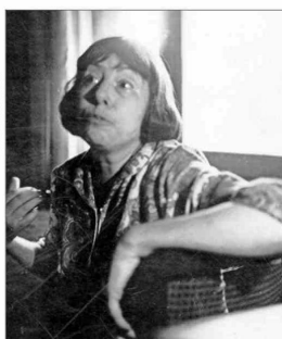
María Luisa Bombal retratada por el periodista.