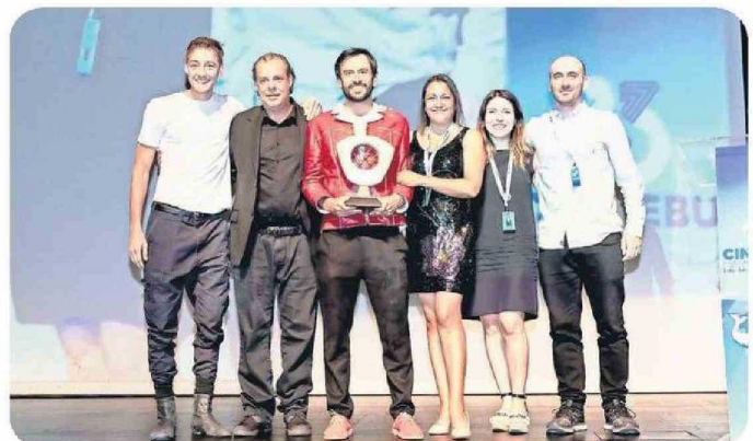
El certamen reúne año a año a diversas personalidades nacionales e internacionales del cine en Lebu y Concepción.

que incluirá la presencia de destacados invitados y momentos inolvidables para compartir", señaló Pino.