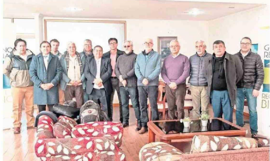
Miembros de gremios del transporte junto al equipo del proyecto en uno de los talleres.