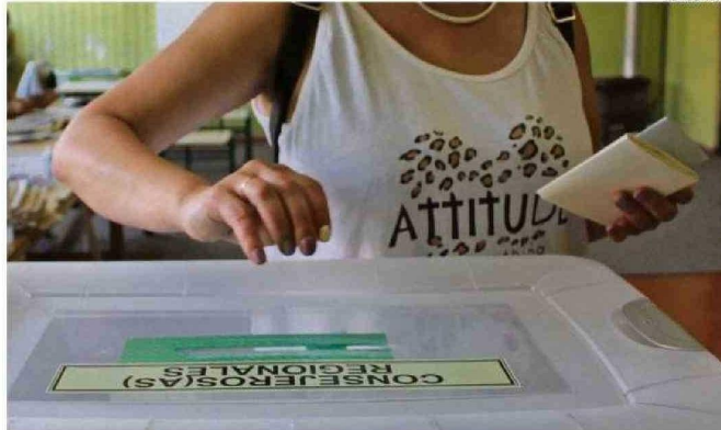
LAS ELECCIONES EN TODO EL PAÍS SE REALIZARÁN EL DOMINGO 24 DE OCTUBRE, CON VOTO OBLIGATORIO.